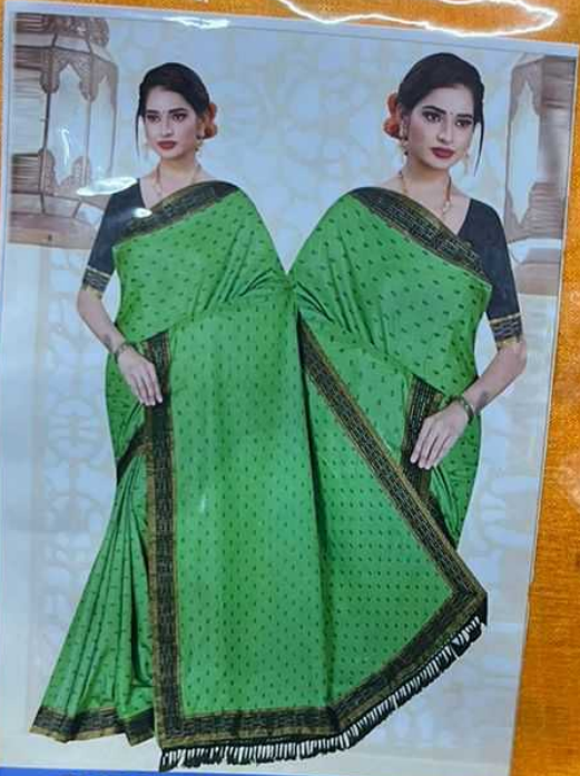
CHECK POINT D.no.1620